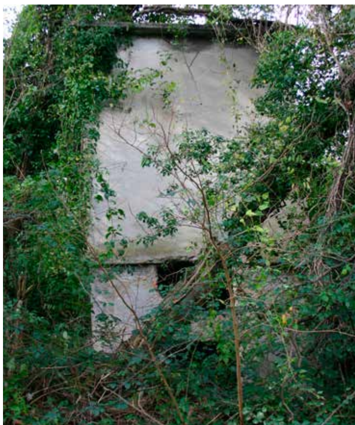
Transformador eléctrico. No consignado en los planos, situado en la derivación del camino hacia el caserío Aginaga berri. De hecho, en 1951 se afirma que Gaintzurizketa alto no disponía de energía eléctrica.