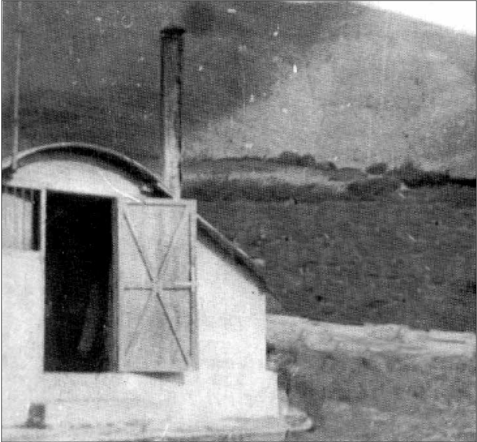
Fotografía de uno de los barracones del campamento Gaintxurizketa.