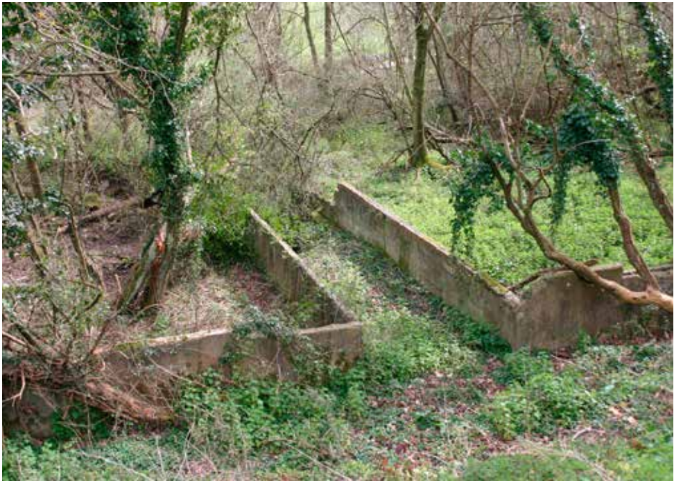
Gaintxurizketa alto. Ruinas de las bases de los barracones (sector inferior)