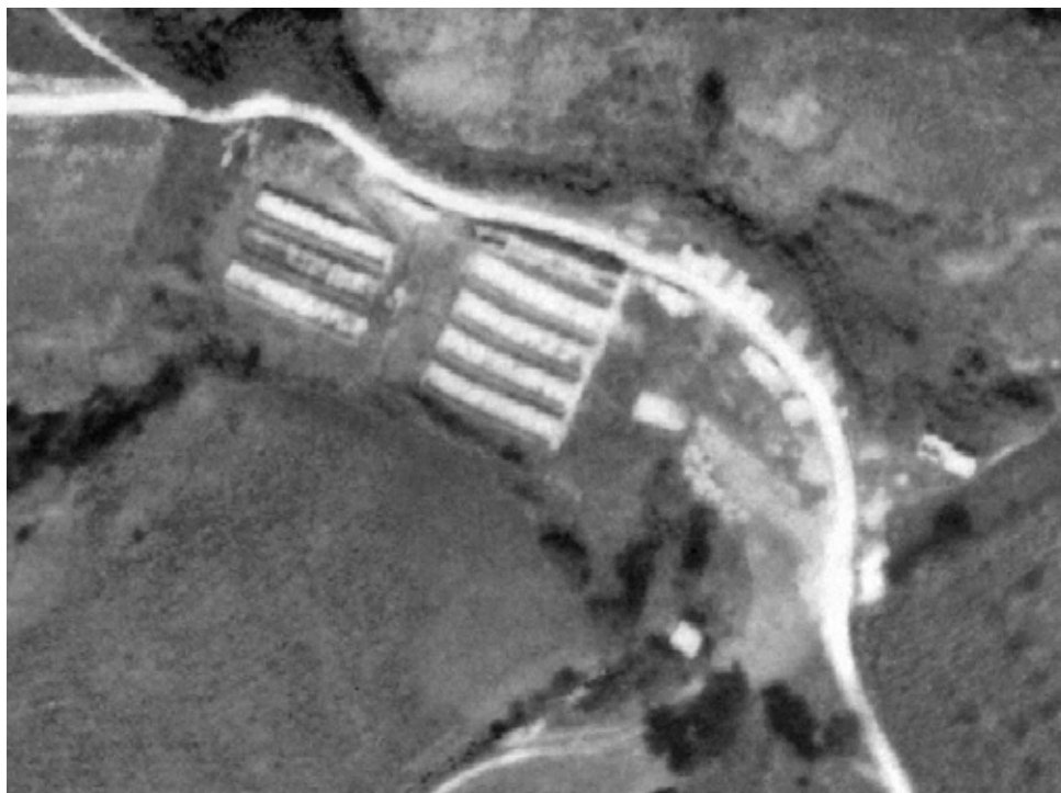
Vuelo americano serie B (1954). Campamento de Gaintxurizketa alto.