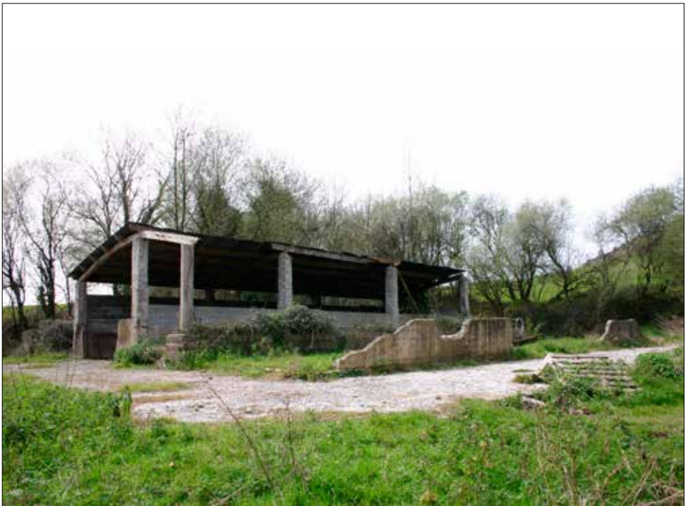
Gaintxurizketa alto. Ruina reutilizadas de los barracones (sector superior).