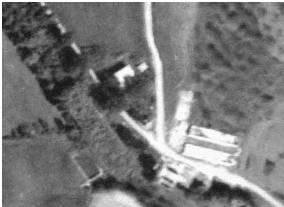
Vuelo americano serie B (1954). Campamento de Gaintxurizketa bajo.(Geoeuskadi).