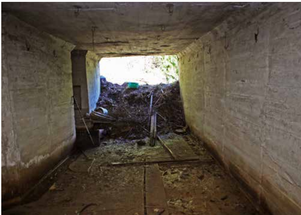
Acceso visto desde el interior de la obra. A la izquierda el acceso al abrigo para los servidores de la pieza.