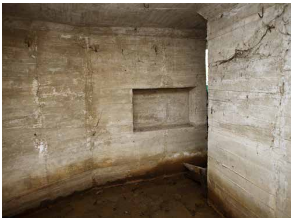
Abrigo para los servidores de la pieza. Acceso desde la estancia principal.