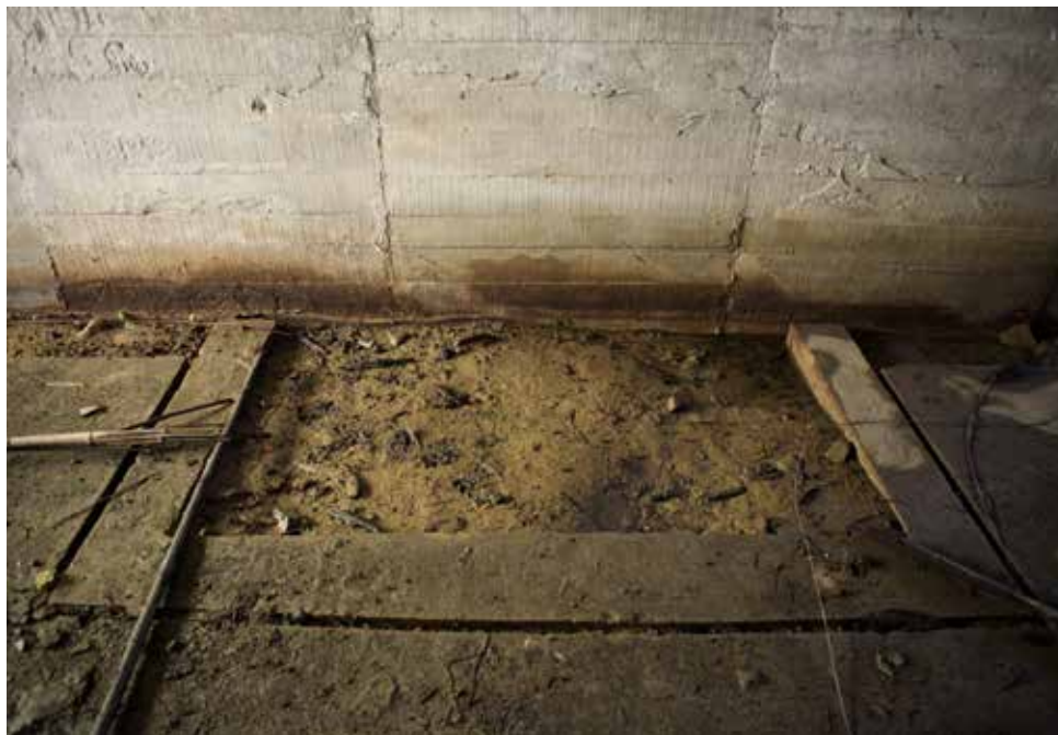
Receptáculo de tierra para el alojamiento de uno de los mástiles del cañón.