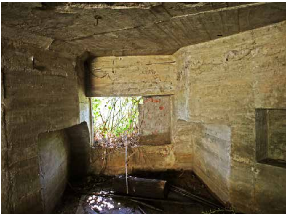
Vista interior de la cañonera, con los rebajes para alojar las ruedas del cañón.