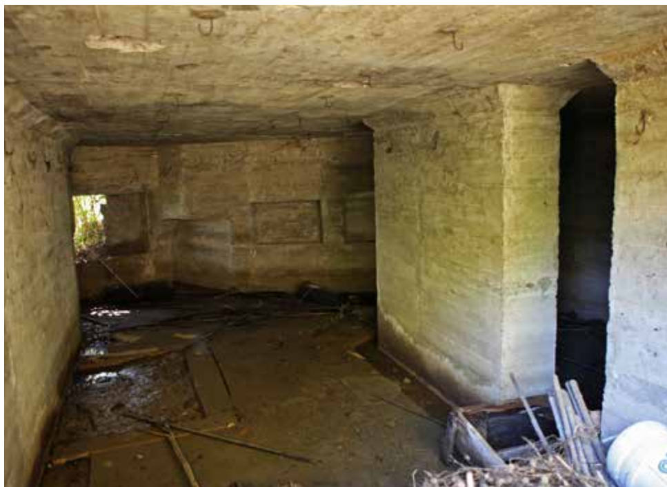
Interior de la desaparecida obra. Al fondo, la cañonera.