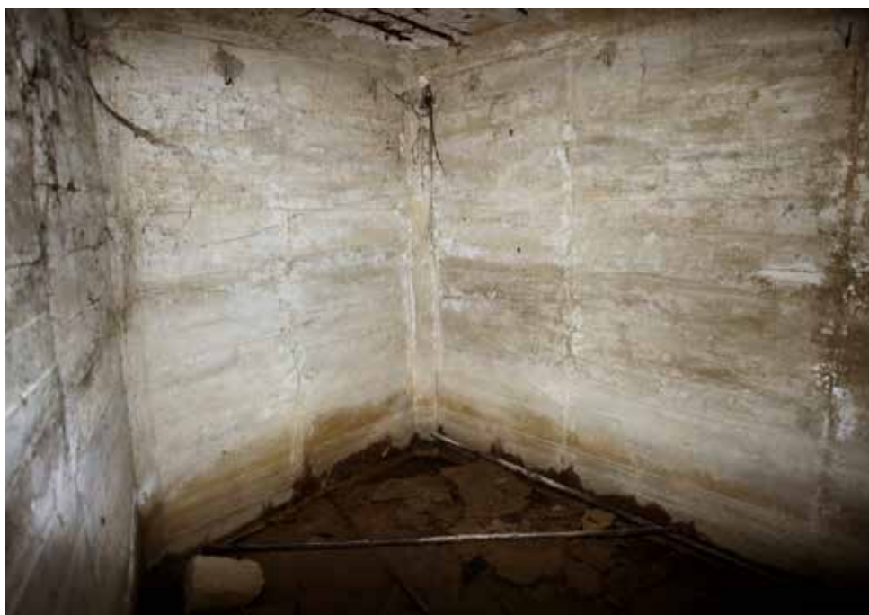
Interior del agrigo para los servidores de la pieza.