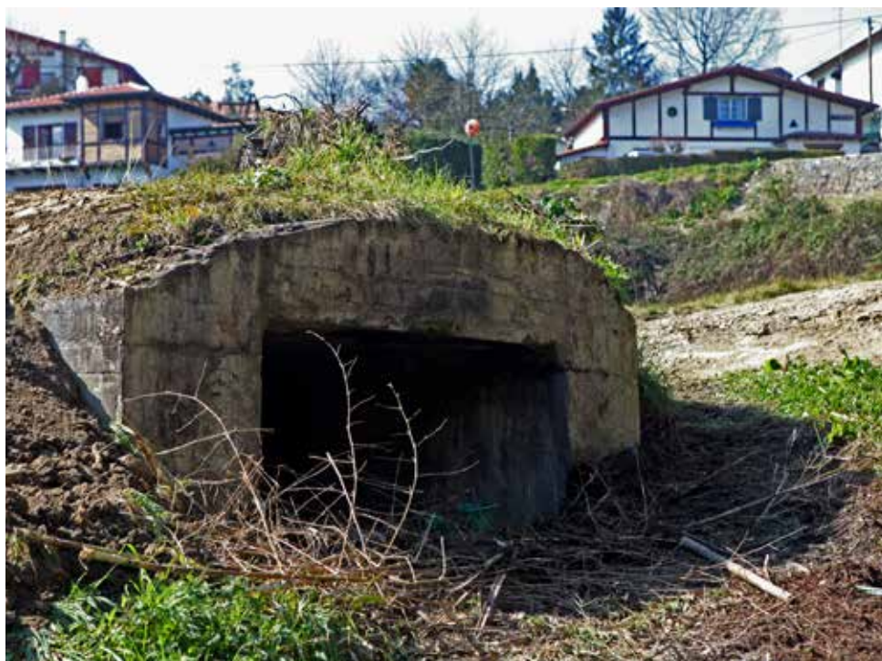
Acceso a la casamata.