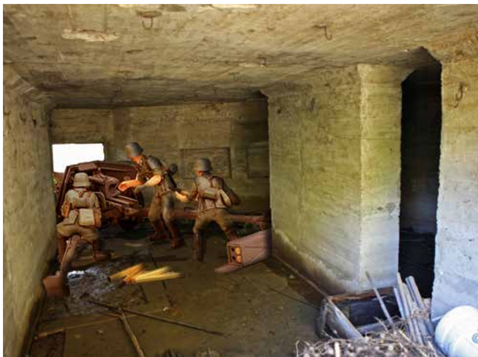
Montaje fotográfico simulando un cañón contracarros en el interior de la Obra.