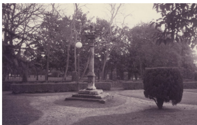
Cruz de San Marcos [1996]. Hondarribiko Udala. Guregipuzkoa.eus [hon003673].

En 1953 se traslada la cruz de San Marcos a su actual ubicación, en la esquina entre la calle Sabino Arana y la calle Irun. La procesión se sigue haciendo hasta el año 1971, año en el que se realiza la última procesión a dicha cruz.