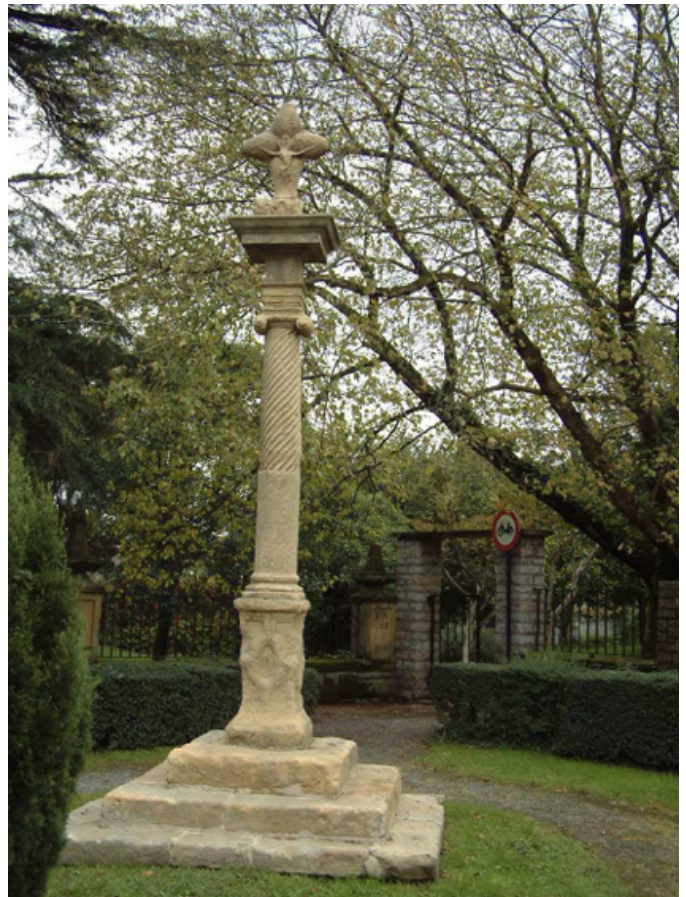
Cruz de San Marcos [2003]. Miren Ayerbe. Ayuntamiento de Hondarribia.

En el año 2002, a instancias de la Asociación de Amigos de la Historia de Hondarribia, que se percató del mal estado de conservación de la cruz, el Ayuntamiento de Hondarribia con ayuda de la Diputación Foral de Gipuzkoa aborda los trabajos de restauración y consolidación.