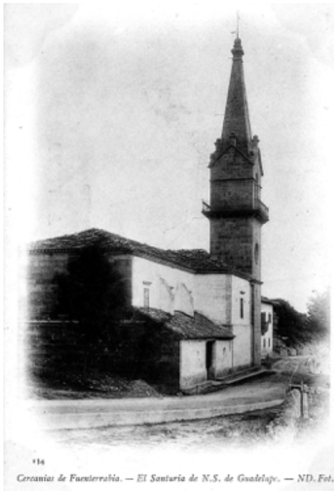
Santuario de Guadalupe [1903]. Autor y editorial desconocido. Archivo Municipal de Hondarribia. N.º 1307.

En Hondarribia, ya en el siglo XVI tenemos constancia de la realización de procesiones el día de San Marcos aunque posiblemente se celebraban también con anterioridad a esa fecha. El día 25 de abril se realizaban tres procesiones para bendecir los campos y proteger las cosechas.