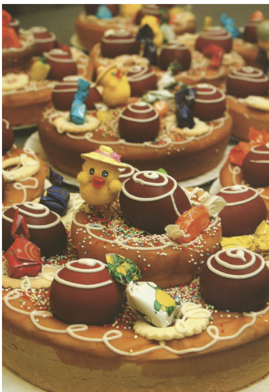
Opilla de San Marcos. Beste Jaiak de Floren Portu

La opilla lleva, según la tradición, tantos huevos como años tiene el ahijado. Las madrinas, sin saber precisar la fecha, se vieron «obligadas» a regalar esta opilla a sus ahijadas y ahijados [hasta que se casan]. Por la mañana las opillas, bien envueltas en paños, se llevan a la iglesia parroquial donde se bendicen y, por la tarde, se organizan romerías a Guadalupe u otros rincones de la ciudad para su degustación.