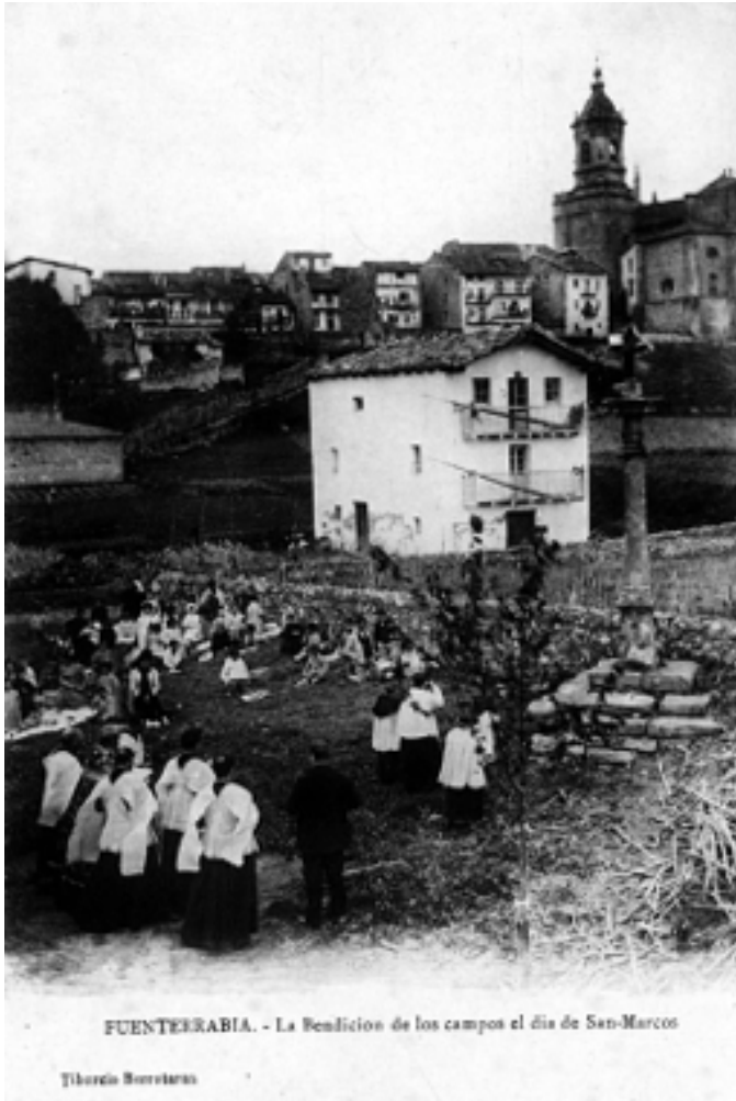
FUENTESRABIA. - La Bendición de los campos el día de San-Marcos