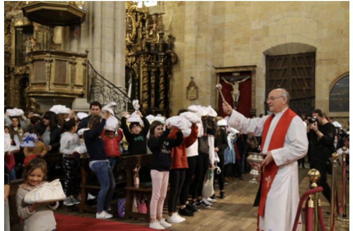
Bendición de las opillas [2019]. ARMA PLAZA Fundazioa.

A partir de 1972 la bendición de la opilla se celebra en el interior de la parroquia y, por supuesto, en otras iglesias de Hondarribia.