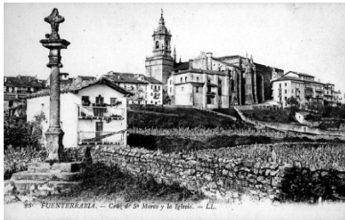
Cruz de San Marcos. Autor desconocido. Editorial: LL. Archivo Municipal de Hondarribia. N.º 0445.

y otros señores capitulares. Salía la procesión de la parroquia después de oída la Santa Misa, cantando las letanías y junto a la cruz los cuatro evangelios en dirección a los cuatro puntos cardinales. Regresando otra vez a la parroquia.