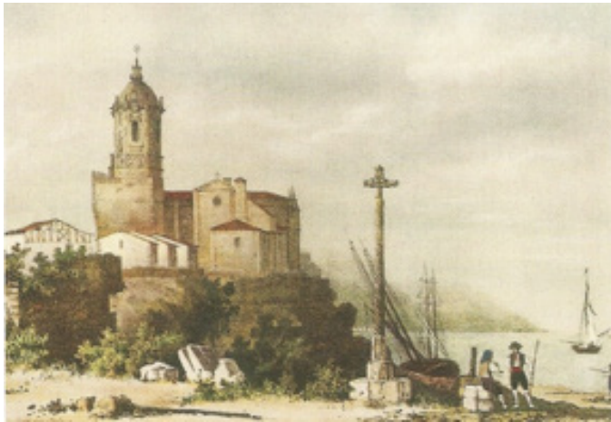
Cruz de San Marcos. Ilustración de Paseos por la ciudad Hondarribia .