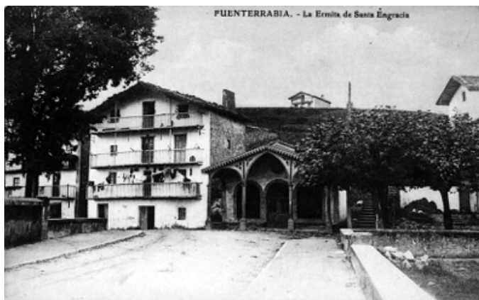
Ermita de Santa Engracia. Autor desconocido. Editorial Gallo E.J.G. Paris-Irun. Archivo Municipal de Hondarribia. N.º 0431.

La procesión regresaba pasando por Mendelu, el convento de Capuchinos y Santa Engracia y finalizaba en la parroquia.