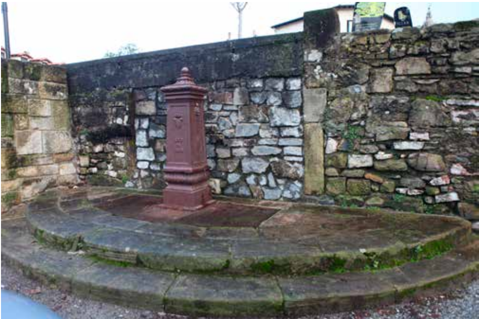
La Fuente en su entorno actual más próximo.

Actualmente situada sobre una plataforma semicircular de dos gradas en la Alameda (Zumardia) de Hondarribia.