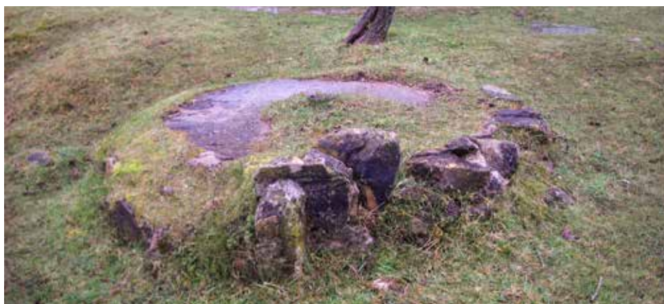
Posible asentamiento de la Fuente.