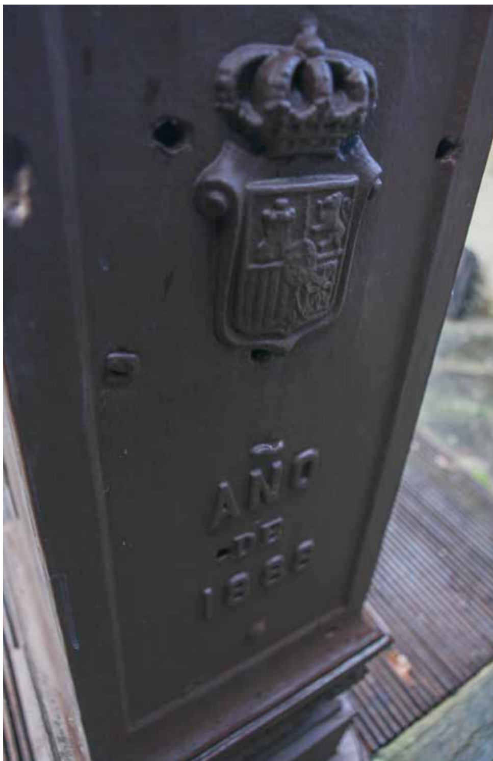
Cara posterior. Se aprecian varios posibles impactos de proyectiles de fusil.