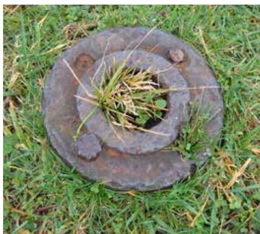
Tubería que asoma del posible asentamiento original de la Fuente formando parte del campamento de la obra del Fuerte