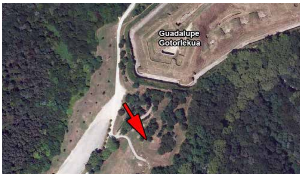
Presumible emplazamiento original de la Fuente, cerca del Fuerte.