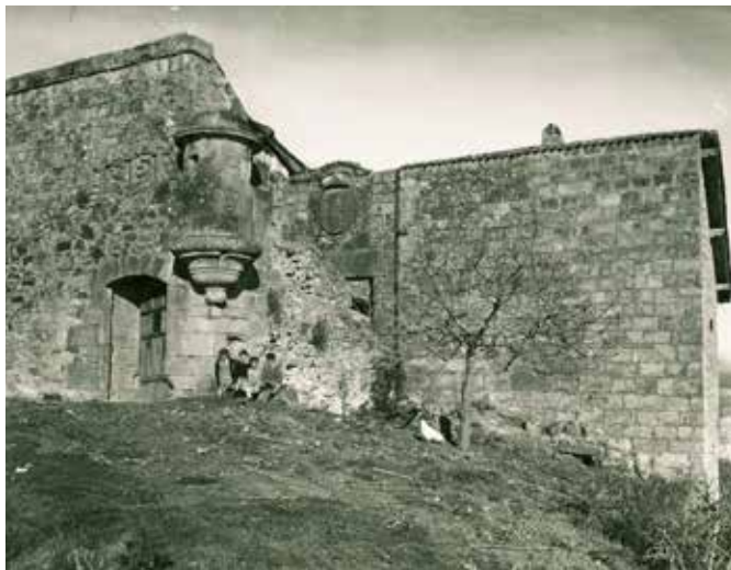
Castillo de San Telmo hacia 1940 (Indalecio Ojanguren. Archivo General de Gipuzkoa. Gure Gipuzkoa).