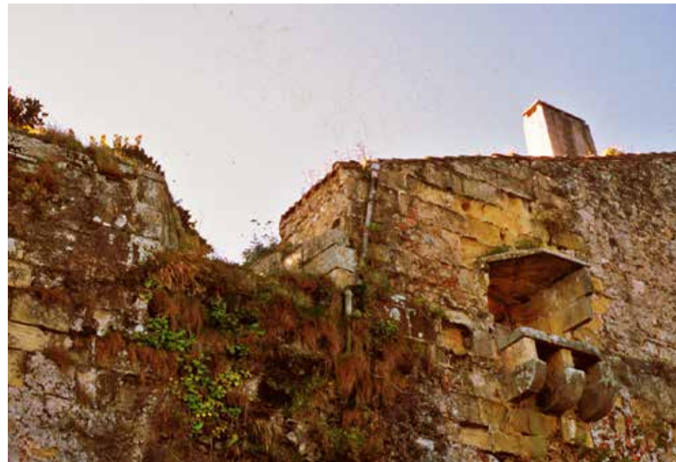
Cañonera y letrina, vistas desde el exterior.