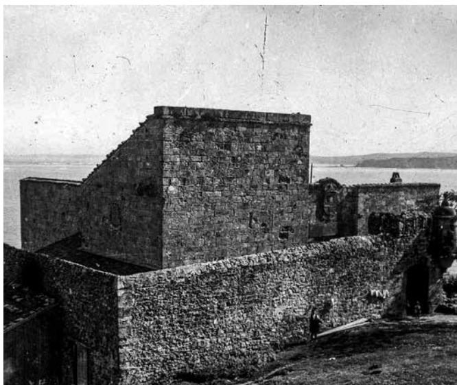
Castillo de San Telmo. Al fondo, la playa de Hendaia. Fot. Indalecio Ojanguren, hacia 1940 (Archivo General de Gipuzkoa, Gure Gipuzkoa).