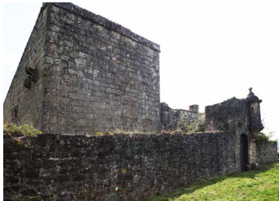
Castillo de San Telmo. Acceso. En primer término el torreón.