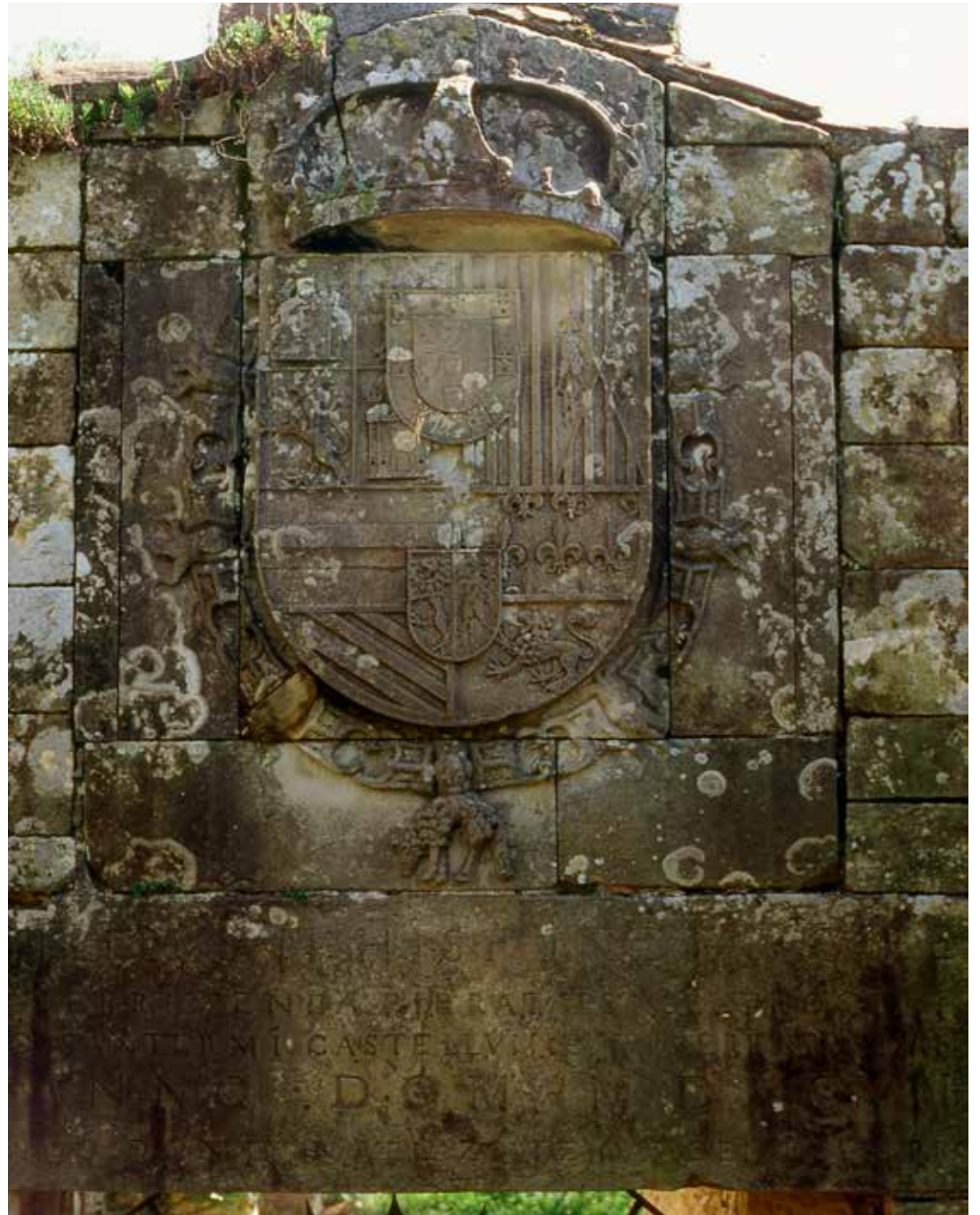
Armas reales e inscripción en el dintel de la segunda puerta.