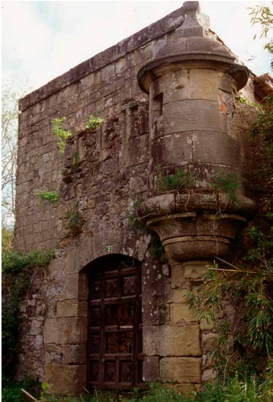
Primera puerta, con su garitón y aspilleras.