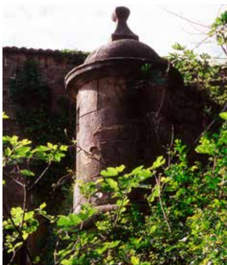
Garitón, en la parte trasera.