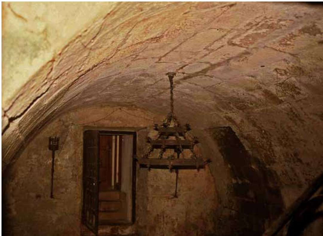
Bóveda interior y acceso a la "torre" (Archivo Dirección General Cultura. Gure Gipuzkoa, 1988).