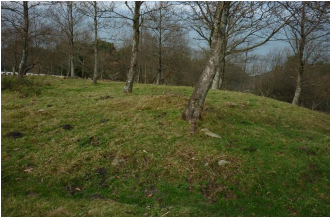
1 Vista General con la carretera GI-3440 y el mar de fondo.