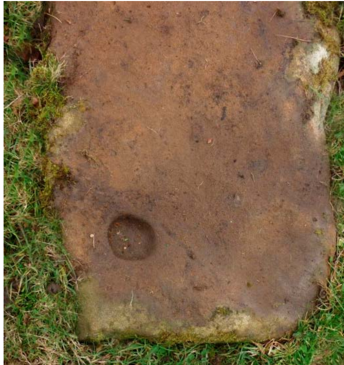
2/ Cazoleta en uno de los ángulos.

Menhir constituido por una única piedra de arenisca de 2 m de altura y 40 cm de ancho, actualmente en posición tumbada. Dispone en uno de sus ángulos de un hueco o “cazoleta” aproximadamente circular de 6 cm de diámetro..