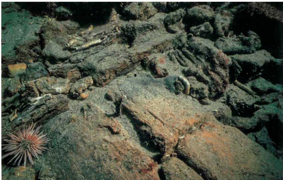
1 Quilla de la nave romana (Arkeoikuska)