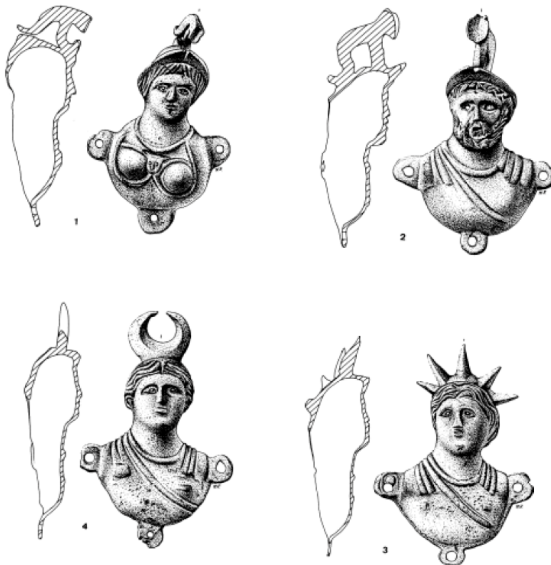
2 Fuente: Los bronces romas de Higer / M. Urteaga.

Tras diversas inmersiones queda probado que el fondeadero de Asturiaga fue repetidamente utilizado como fondeadero natural en diversas épocas, no solo romana.