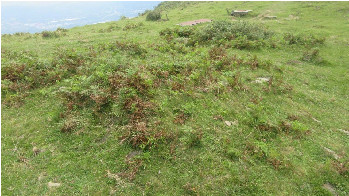
1 Vista general.