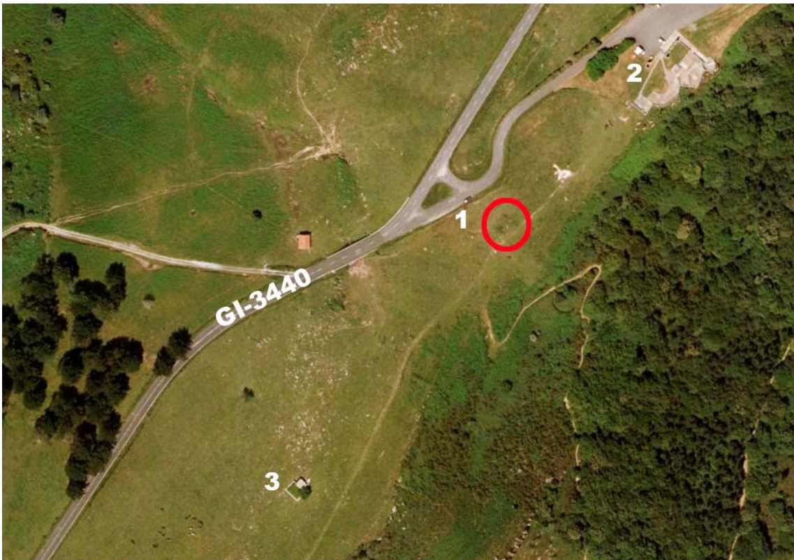
3 1 Túmulo. 2 Antiguo parador de turismo. 3 Depósito de agua del antiguo Parador.