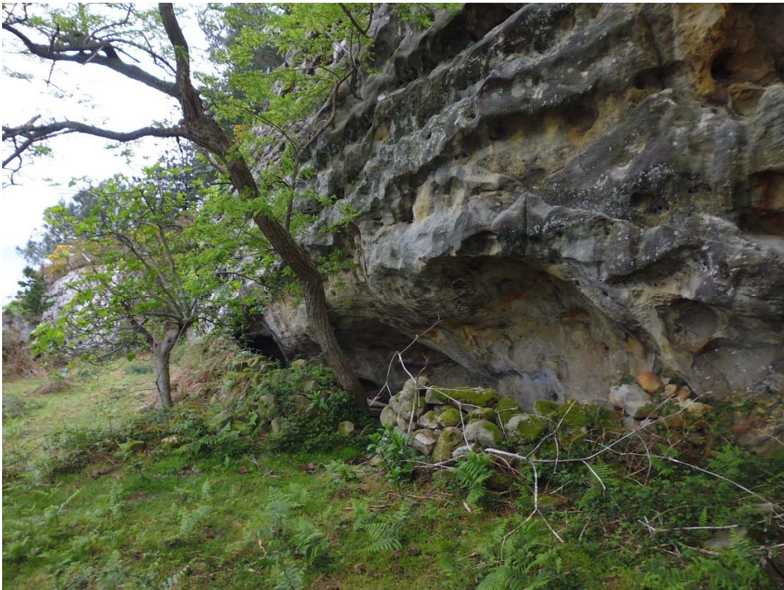
1 Vista general.