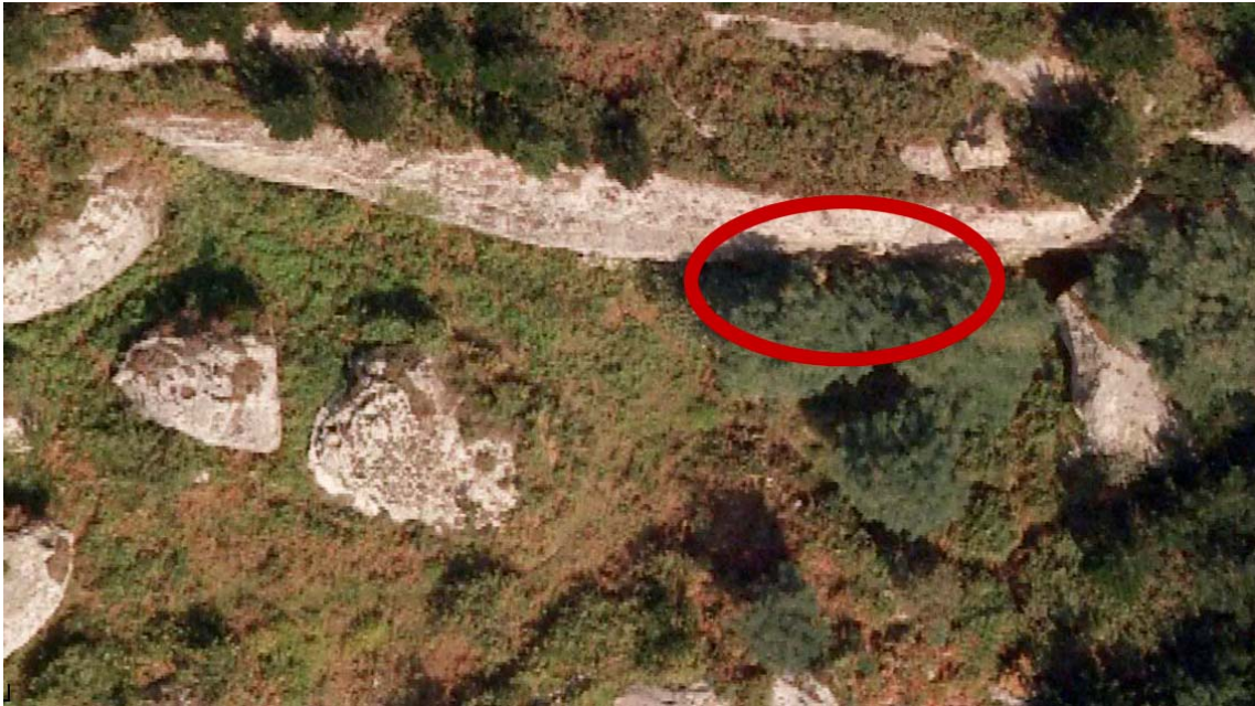
3 Ortofoto