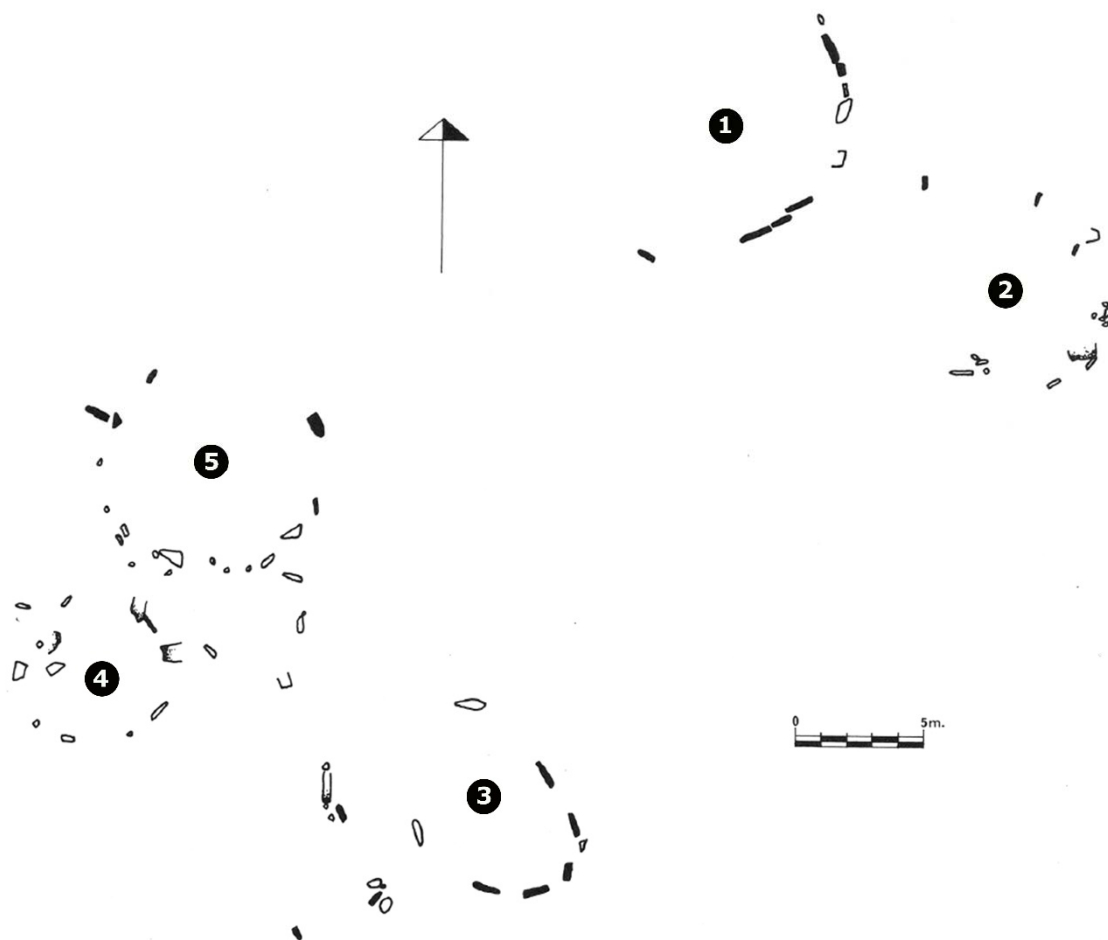
3 Los cinco cromlechs de Jaizkibel II. (Carta Arqueológica de Gipuzkoa).